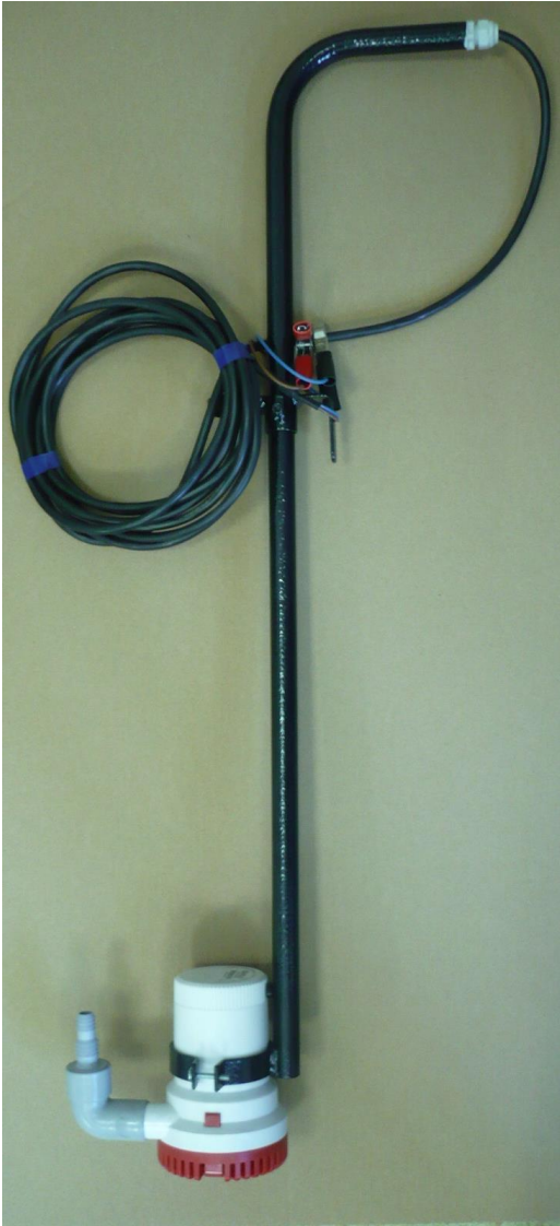
Abb.1 Auf den Auslass der Tauchpumpe einen Schlauch \frac{1}{2} oder \frac{3}{4} Zoll stecken und mit einer Schlauchschelle befestigen

Abb.2 Die Höhe des Schiebehakens einstellen, mit dem die Pumpe an der Behälterwand fixiert wird, entsprechend der erforderlichen Tiefe. Die Pumpe in Wasser tauchen und den Schlauch an die Bewässerungsstelle legen.